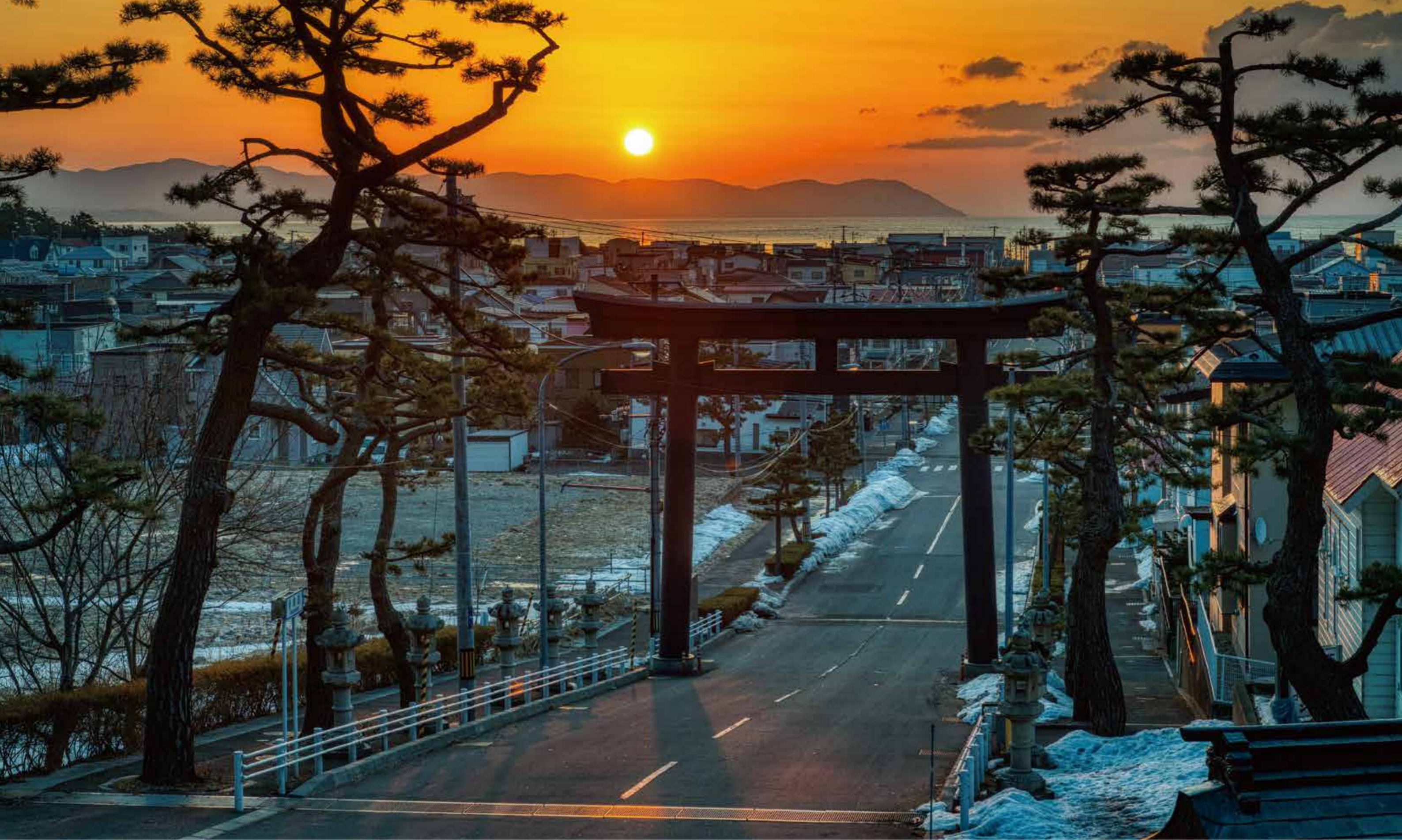
浜からの朝日が参道を照らす