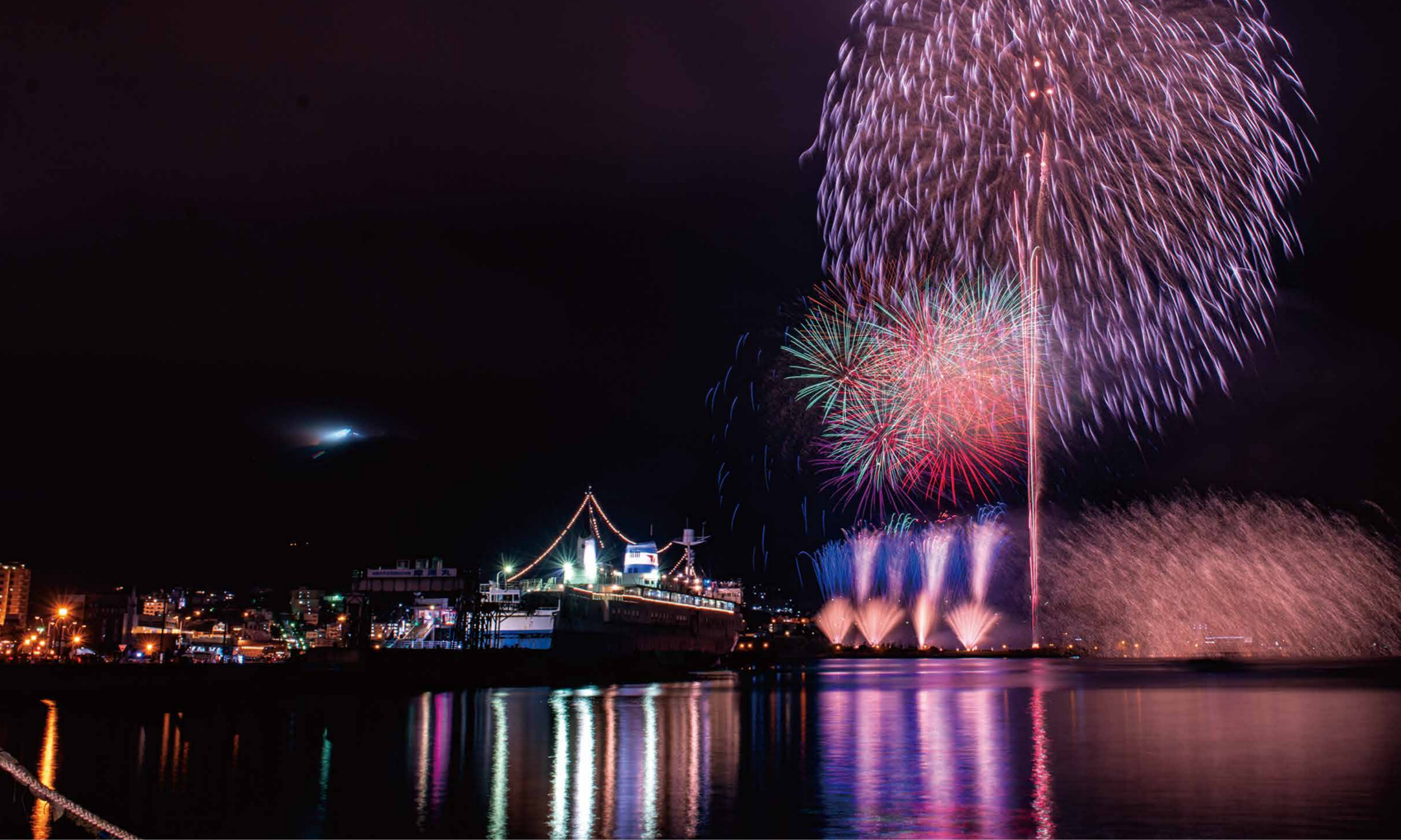
解放された希望が大輪を咲かす