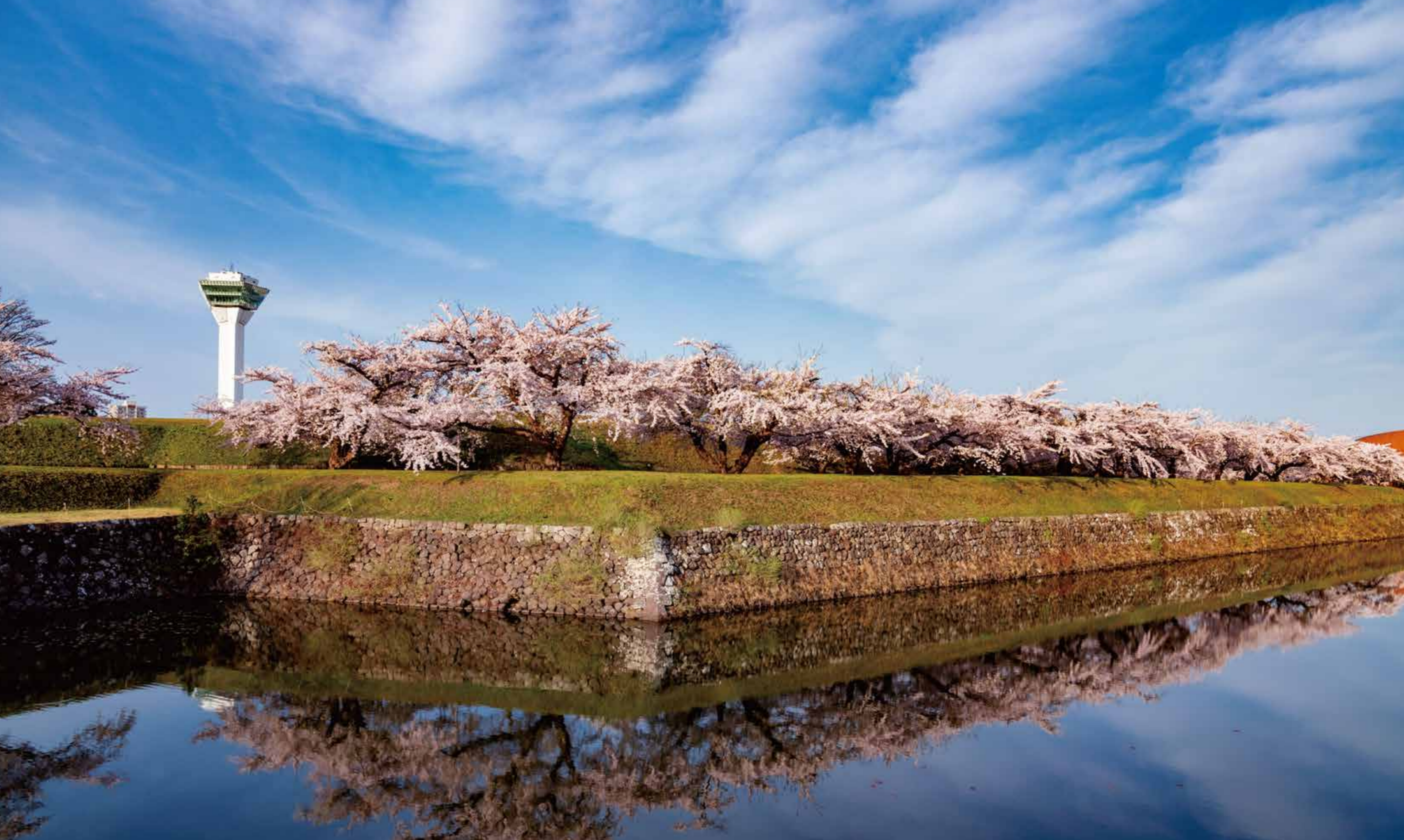
水面と空が桜の舞台を演出