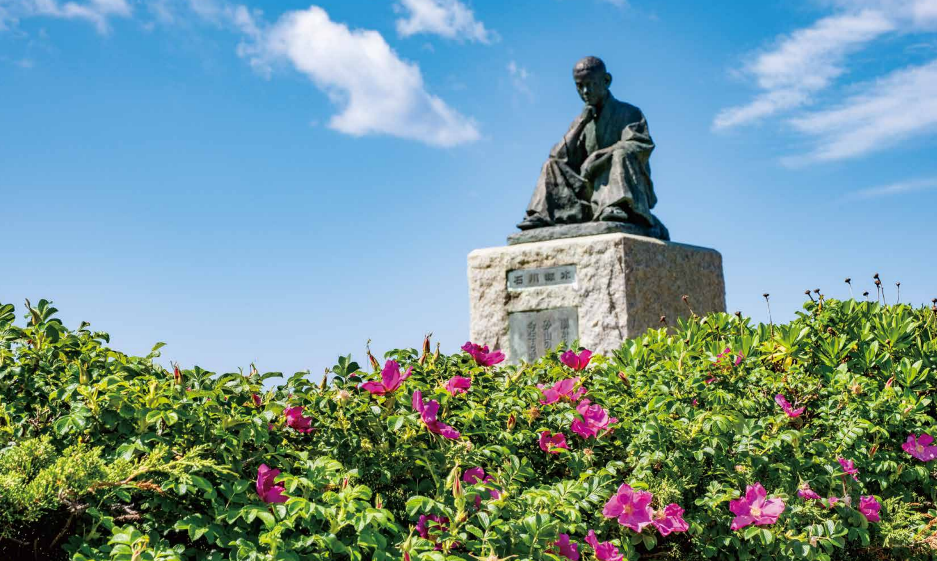
海峡を望む公園にハマナスが咲き誇る